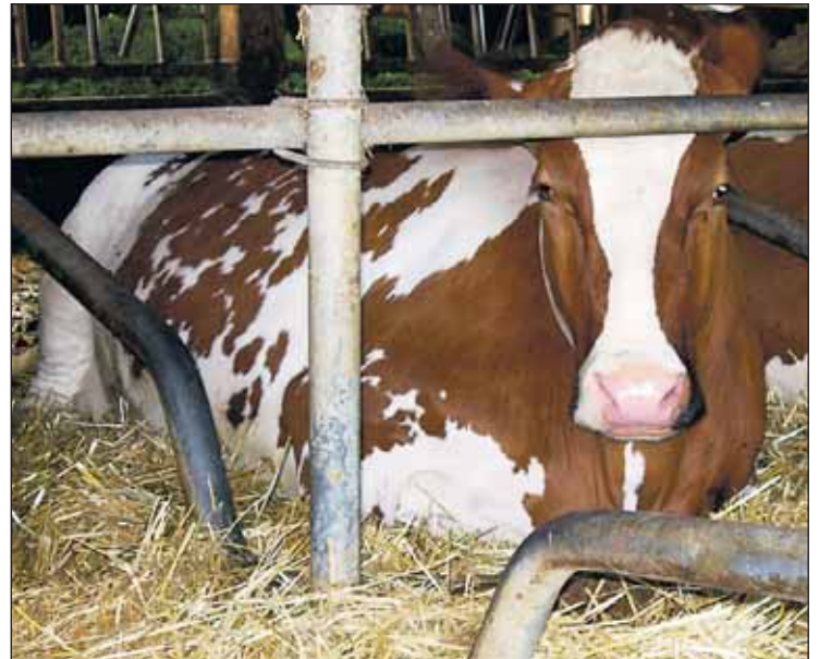
De bonnes conditions de garde avec des surfaces de couche et des logettes sèches favorisent une bonne santé des onglons.

Les toxines du fourrage ou les déchets métaboliques provenant d'organes malades (par exemple pis ou matrice), peuvent endommager les petits vaisseaux sanguins du tissu podophylleux. Du sang et du liquide lymphatique arrivent dans la couche de liaison et endommagent les cellules responsables de la formation de la corne. De ce fait, la corne devient molle et cassante. Une surcharge des onglons, par exemple en raison de soins inadéquats des onglons ou de modifications hormonales après le vêlage, exerce un effet similaire. Cette affection du tissu podophylleux s'appelle fourbure ou pododermatite aseptique diffuse. Dans la majorité des cas, les vaches souffrent d'une forme chronique ou latente de la maladie, qui affaiblit le