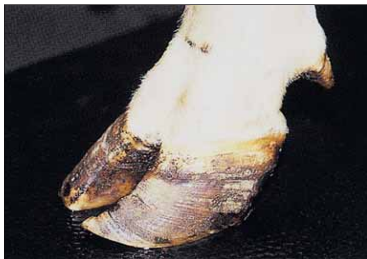
Fourbure: Modification typique des onglons, qui sont endommagés par la pododermatite aseptique diffuse chronique: stries sur la corne de la muraille et affaissement de la paroi antérieure de l'onglon.

avec de grandes quantités de concentrés, comporte le risque d'une suracidification de la panse avec une panoplie de conséquences négatives sur la santé des onglons. De manière générale, tout changement au niveau de l'affouragement devrait se faire progressivement, afin de préserver les microbes et ainsi maintenir l'équilibre dans la panse.